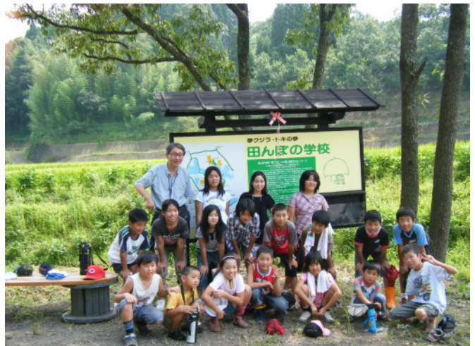
竹田市立岡本小学校の児童たちとともに看板の前に立つ。