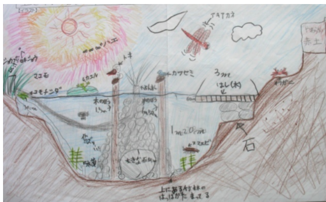
写真2 『くじら池』の断面図 竹田市立岡本小学校の子どもたちが環境学習した後に設計した。地元の水生生物やカワセミ達が繁殖できるように工夫した『くじら池』を提案。写真は断面図

子どもたちは、今いる里の生き物たちのために 未来のトキのために、被害にあいかけた里山の生き物たちを避難させ、彼らが安心してすめる生息空間〔ビオトープ〕について学習しました。そして、数多くの“夢ビオトープ”を設計し、おとなたちと一緒にあって、『夢水路』『かめ池』『くじら池』【3枚の写真】などのビオトープをつくりあげました。