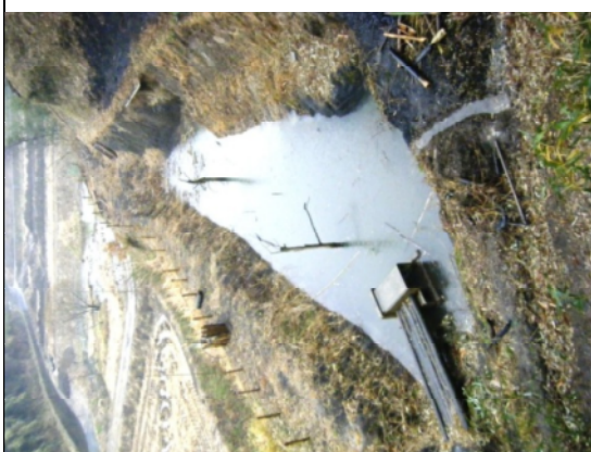
写真3 『くじら池』の全景 完成した『くじら池』の全景。手前がクジラの口で、向こう側が尾のつもり...

写真2 『くじら池の平面図』 環境学習をする前、岡本の子どもたちは野生のクジラをこの里の住ませたいと言っていた。その夢をあきらめず、鯨の形をした池を設計した。ビオトープ名も『くじら池』