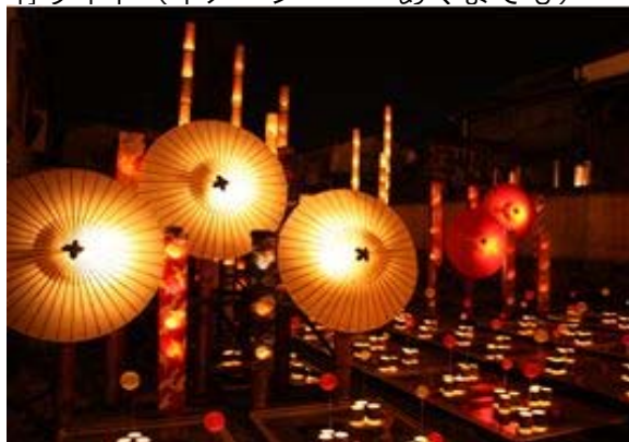
竹ライト（イメージ・・・あくまでも）