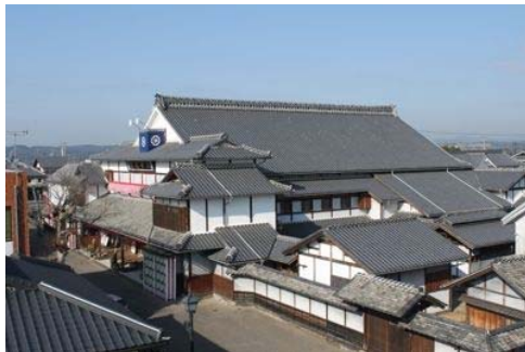
八千代座（重要文化財）

今回の九州パッション in 山鹿の会場になっている八千代座について、八千代座復興に携わった関係者からの説明や、八千代座内部の見学等を行います。