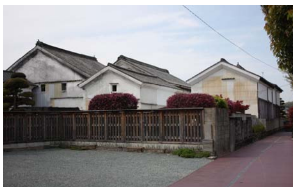
製作会場：天聴の蔵