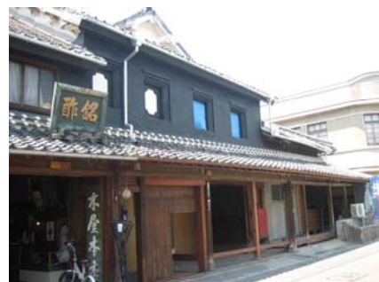
千代の園酒造（本田家住宅）